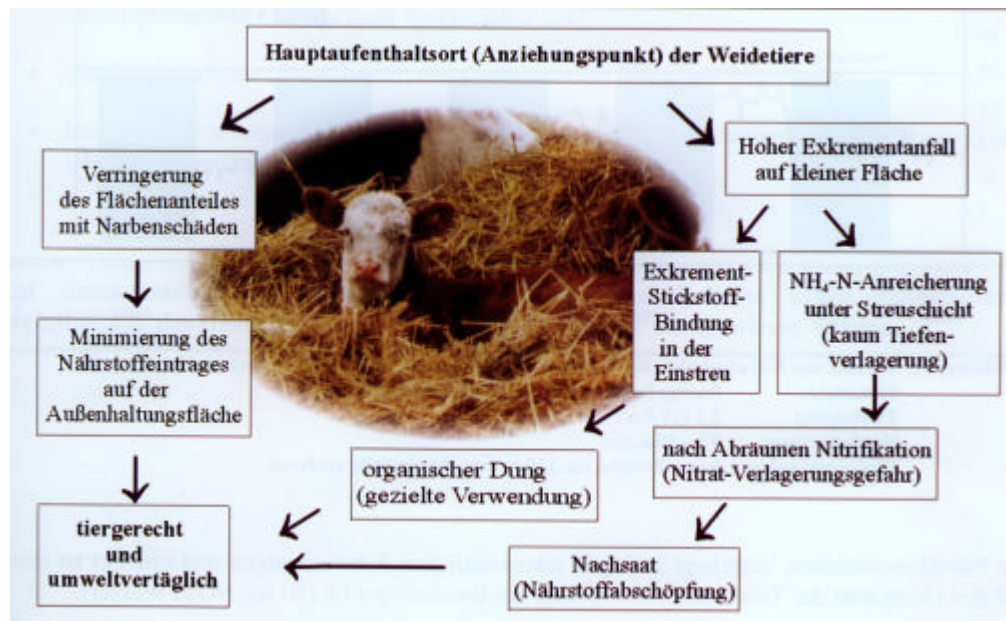
Abbildung 3: Wirkungen von Einstreumatten